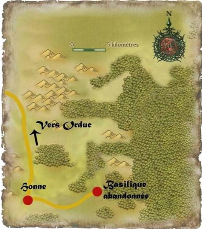
Carte 2 - La basilique abandonnée